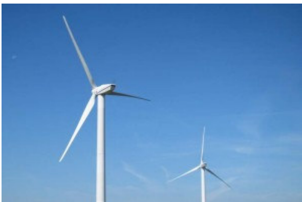
Windindustrieanlagen im Wald: Welche Gefahren gehen von ihnen aus?

Windindustrieanlagen (Windindustrieanlagen an Land), auch Windkraftanlagen (WKA) genannt, werden in Deutschland zunehmend in Wäldern errichtet, die sich in Wasserschutzgebieten erstrecken. Neben der potentiellen Gefahr einer