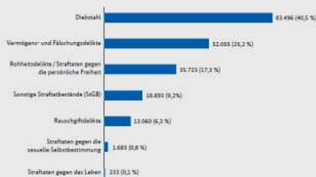
Deliktische Verteilung der Straftaten begangen durch Zuwanderer 2015 (ausgewählte Bereiche)

Die beiden BKA-Berichte sind unter diesem Link auf der Homepage des Bundeskriminalamts abrufbar: https://goo.gl/4NVDSB