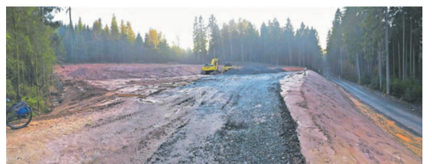
Bürgerinitiative: „Der Naturpark wird zum Industriepark.“

Die Linsengerichter Bürger sind durch ihre klare Entscheidung von 2013 gegen den Bau von Windkraftanlagen auf dem Gemeindegebiet vom Regionalplan nicht direkt betroffen. Allein die Weißfläche 2-78 zwischen Eidengesäß und Kassel könnte noch Ungemach bringen. Im Gegensatz dazu ist Biebergemünd von der jetzigen Planung stark betroffen. Der Regionalplan enthält für den Bereich Biebergemünd die beiden Vorrangflächen 2-304 und 2-308, die aufgrund ihrer schieren Größe (Fläche 2-304) beziehungsweise mit einem Abstand von deutlich unter 1000 Metern zur nächsten Wohnsiedlung (Fläche 2-308) zu einer massiven Beeinträchtigung der Anwohner führen werden. Die Fläche 2-304 nördlich von Bieber ist mit etwa 450 Hektar eine der größten Vorrangflächen in Südhessen. Hinzu kommen aufgrund des Weißflächenkonzepts noch zusätzliche Flächen mit einer Gesamtgröße von etwa 360 Hektar, die bis zu einer endgültigen Entscheidung ebenfalls noch mit Windkraftanlagen bebaut sind. Die von der Politik stets gepriesene Ausschlusswirkung des Regionalplans bringt den Bürgern der Gemeinde Biebergemünd damit derzeit wenig. Mit aktuell über 800 Hektar bebauter Fläche im direkten Einzugsgebiet könnte die Gemeinde zu einem weiteren Schwerpunkt des Windkraftausbaus im Kreis werden.