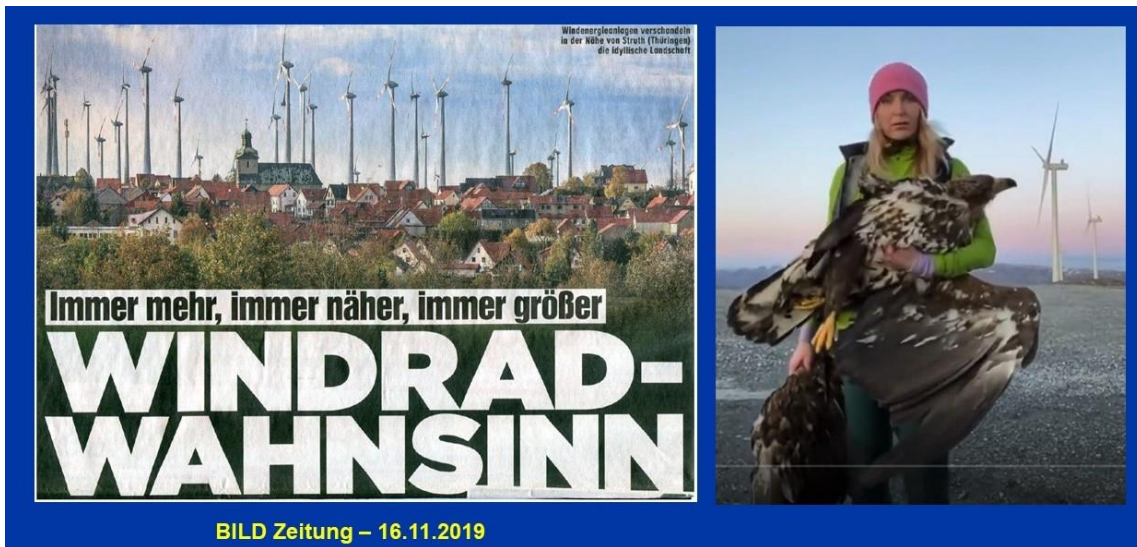
Abbildung 4: Links: Windkraftanlagen in der Nähe von Struth (Thüringen) verschandeln die idyllische Landschaft Rechts: von einem Windrad getöteter Greifvogel

Schattenwurf, Infra-Schall, Vogel-, Fledermaus- und Insektenschlag, Raubbau an der Natur und Verschandelung der Landschaft (Abbildung 4) sind die bekanntesten Argumente gegen Windkraftanlagen. Kaum bekannt hingegen ist der Dürre-Effekt der Windräder. Er entsteht infolge der atmosphärischen Verwirbelung durch die Turbinenblätter.